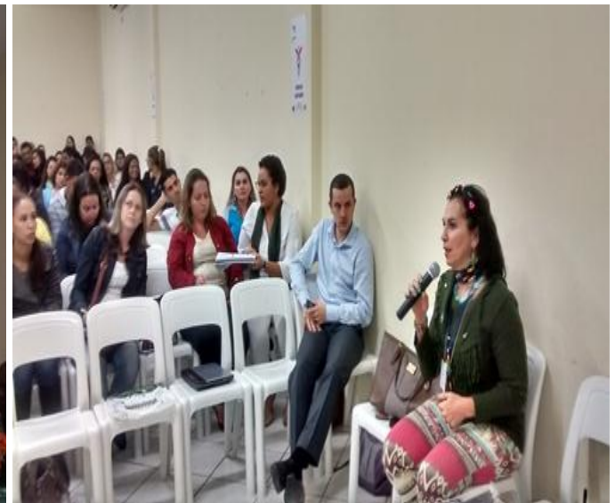
HISTÓRIA JURÍDICA DA PROPRIEDADE PRIVADA E DO CRESCIMENTO DAS CIDADES