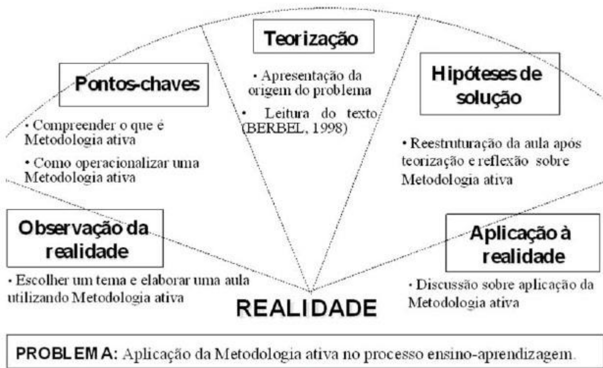
Figura1: Planejamento do Arco da Problematização de Charles Maguerz.

Portanto, todas as técnicas e instrumentos utilizados no processo de aprendizagem serão encaminhados no sentido de uma estreita relação entre a teoria e a prática, buscando a integração entre as duas visões, constituindo-se de aulas a partir do método de problematização de estudos de caso, debates em sala de aula, com teorização final na aula com apresentação expositiva, com trabalhos individuais e/ou em grupo, palestras, exercícios em laboratórios específicos, visitas técnicas, seminários, iniciação científica em laboratórios específicos do curso, em laboratórios de informática e biblioteca e outras atividades em função da especificidade de cada disciplina, completando-se pela realização das Atividades Acadêmicas Científicas Culturais (AACC), das disciplinas optativas e, acima de tudo, dos Projetos Integradores implantados a cada