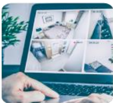
Monitoramento interno 24H