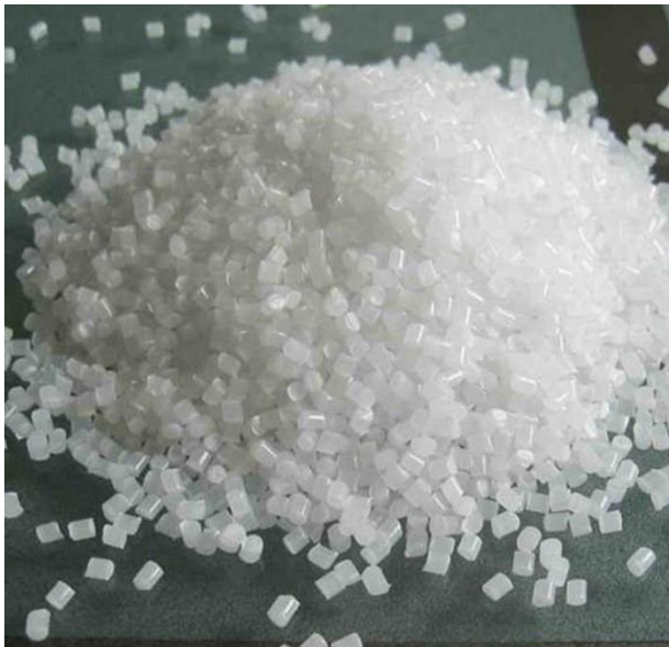
Figura 4: Polipropileno

Principais aplicações: Tecido Não tecido, embalagens flexíveis, rafia (Sacos para grãos e fertilizantes), fibras, cadeiras plásticas, brinquedos, copos plásticos, embalagens e recipientes para alimentos, remédios e produtos químicos, corpo de eletrodomésticos (Ferro de passar, liquidificador, batedeira), tampas em geral, tampas para bebidas carbonadas (água, refrigerantes), carpetes, seringas de injeção, material hospitalar esterilizável, autopeças (coletores de admissão, filtros de ar, para-choques, pedais, carcaças de baterias, interior de estofados, lanternas, ventoinhas, ventiladores, peças diversas no habitáculo), peças para máquinas de lavar, cabos para ferramentas manuais. Atualmente há uma tendência no sentido de se utilizar exclusivamente o PP em peças de motores e de interior dos automóveis. Isso facilitaria a reciclagem do material por ocasião do sucateamento do veículo.