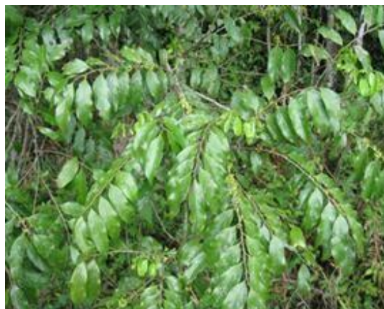
Fig. 2 - Apresentação em árvore, folhas da planta

http://www.fitoterapicos.info/guacatonga.php