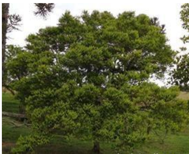
Fig. 1 - Apresentação em árvore.

florestas como em áreas abertas. Essa extensa distribuição também resulta em grande variação no seu tamanho, forma e textura de suas folhas (FITOTERÁPICOS GUAÇATONGA, 2017). A Guaçatonga produz pequenas flores brancas ou creme-esverdeadas que têm um odor semelhante ao mel. Seus frutos são diminutos, de cerca de meio centímetro, de cor avermelhada, cuja disposição e cor lembram um cafeeiro (FITOTERÁPICOS GUAÇATONGA, 2017).