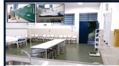
LABORATÓRIO DE ENFERMAGEM