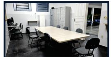
SALA DOS PROFESSORES