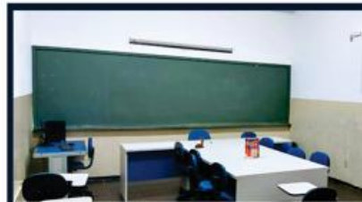
NÚCLEO DE PRÁTICA JURÍDICA