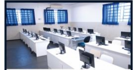
LABORATÓRIO DE INFORMÁTICA