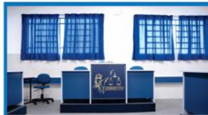
TRIBUNAL DO JÚRI