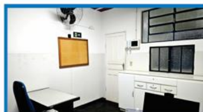
NÚCLEO DE VESTIBULAR