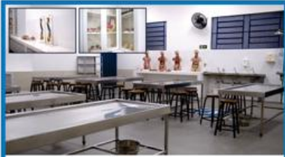
LABORATÓRIO DE ANATOMIA