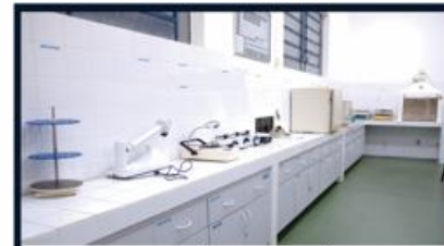
LABORATÓRIO DE QUÍMICA