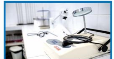
LABORATÓRIO DE QUÍMICA