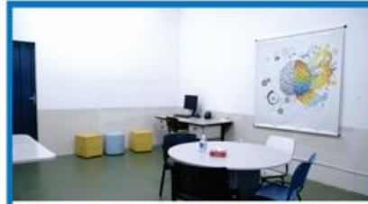
LABORATÓRIO DE PSICOLOGIA 2