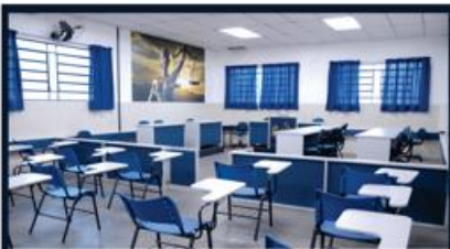
TRIBUNAL DO JÚRI