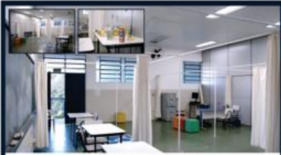
LABORATÓRIO DE PSICOLOGIA