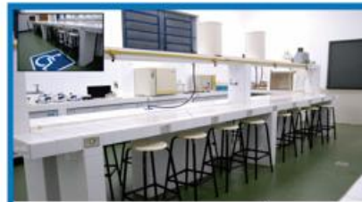
LABORATÓRIO DE QUÍMICA