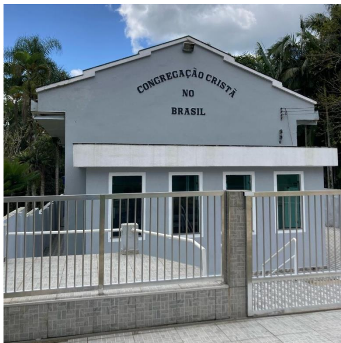
Figura 1- Igreja Congregação Cristã no Brasil da Comunidade Quilombola de Peropava 3