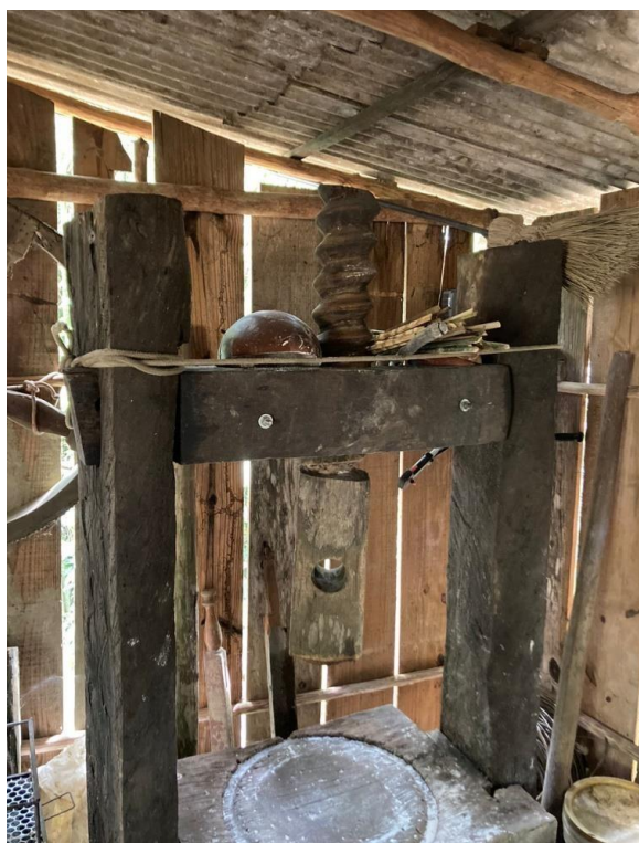
Figura 2 – Equipamentos utilizados para a produção da farinha de mandioca 5