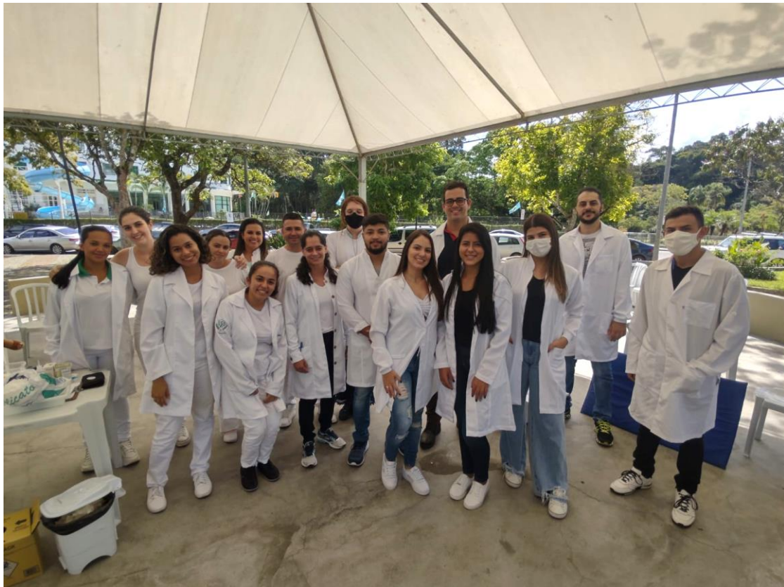
FIGURA 12: ACADÊMICOS DO CURSO DE EDUCAÇÃO FÍSICA, FISIOTERAPIA, FARMÁCIA E NUTRIÇÃO NO EVENTO DO DIA 09 DE ABRIL DE 2022.