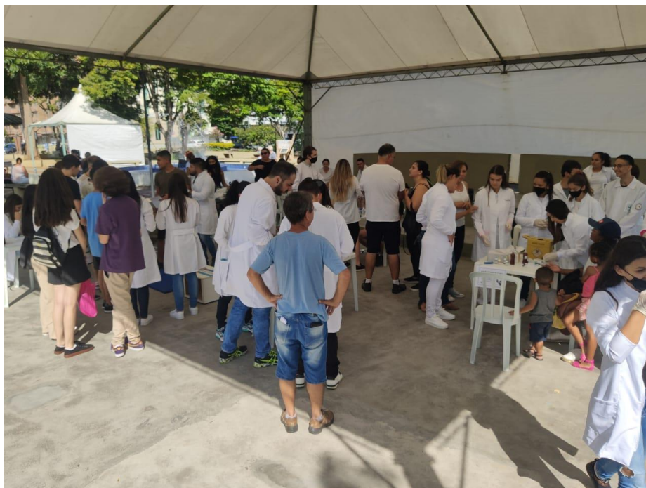
FIGURA 13: ATENDIMENTOS SENDO REALIZADOS NO SÁBADO SAÚDE" (09 DE ABRIL DE 2022).