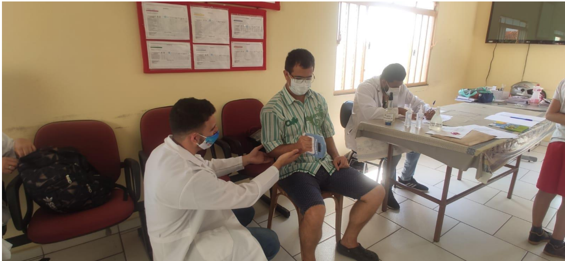
FIGURA 4: ACADÊMICO DO CURSO DE EDUCAÇÃO FÍSICA REALIZANDO A AVALIAÇÃO DA FORÇA MUSCULAR DE UM DOS PACIENTES ADSCRITOS NA UBS PORTA DO CÉU.