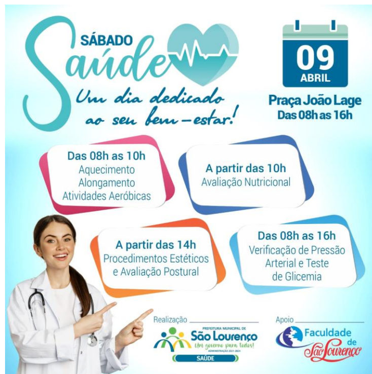
FIGURA 12: BANNER DE DIVULGAÇÃO DO EVENTO “SÁBADO SAÚDE”, REALIZADO NO DIA 09 DE ABRIL DE 2022 NO CENTRO DE SÃO LOURENÇO.