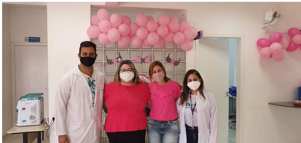
FIGURA 8: COORDENADORES DA FACULDADE DE SÃO LOURENÇO DURANTE AS ATIVIDADES DESENVOLVIDAS PARA O OUTUBRO ROSA (CENTRO VIVA VIDA – SÃO LOURENÇO)