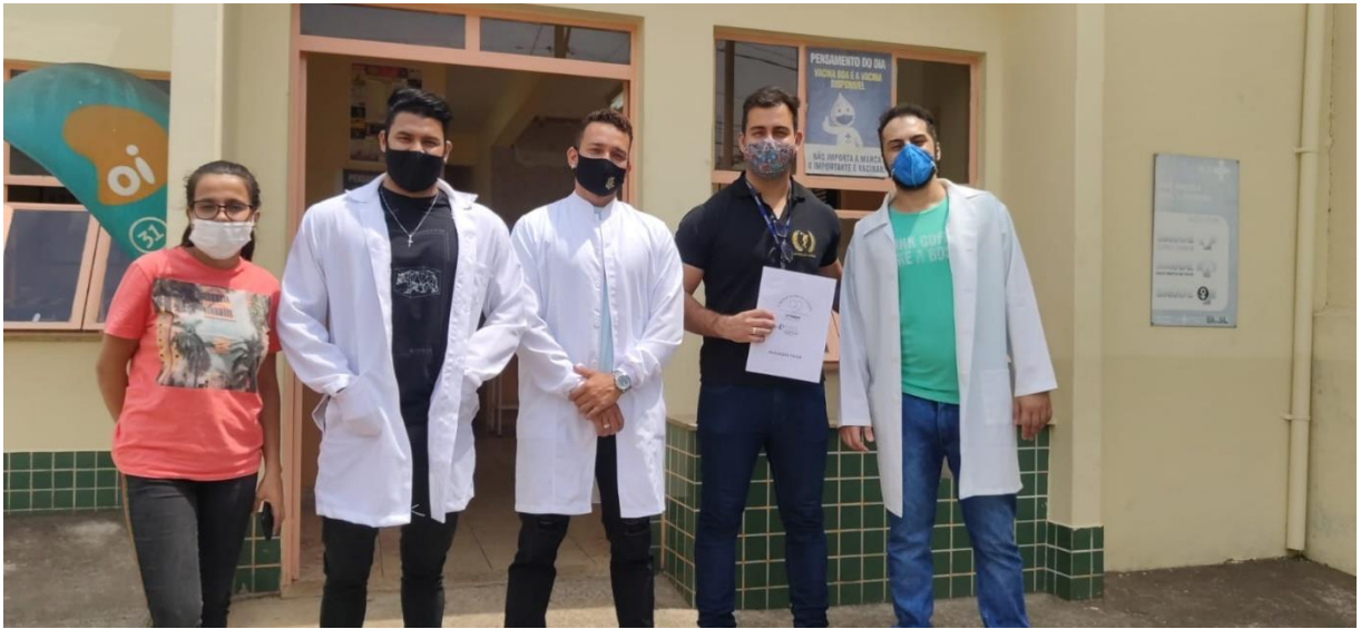
FIGURA 6: COORDENADOR E ACADÊMICOS DO CURSO DE EDUCAÇÃO FÍSICA DURANTE ATIVIDADES NA UBS CARIOCA.