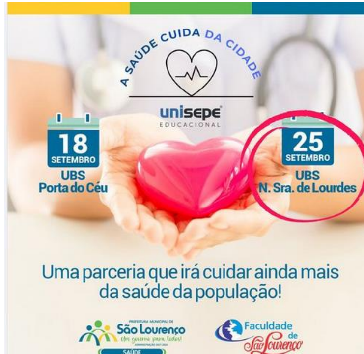
FIGURA 2: BANNER DE DIVULGAÇÃO DAS AÇÕES DO PROJETO “A SAÚDE CUIDA DA CIDADE” NO SEGUNDO SEMESTRE DE 2021.