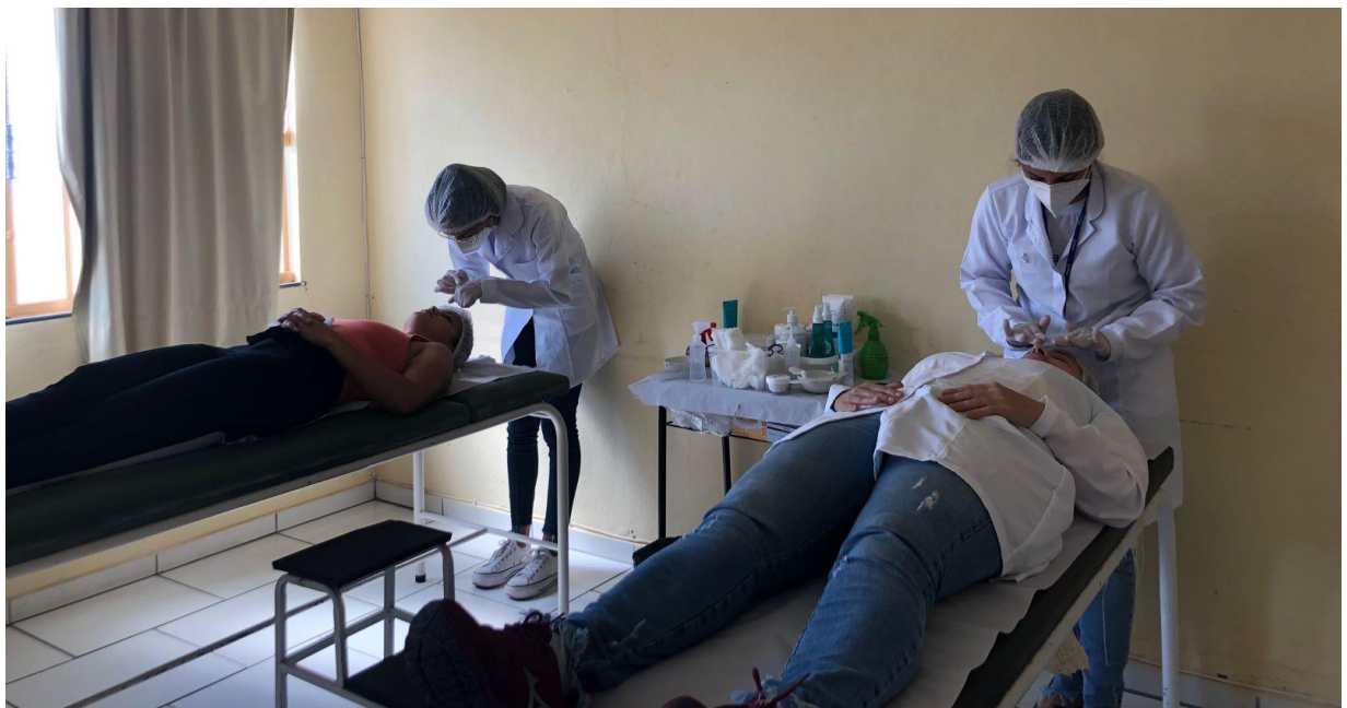
FIGURA 5: PROCEDIMENTO DE LIMPEZA DE PELE, REALIZADO POR ACADÊMICOS DO CURSO DE ESTÉTICA E COSMÉTICA DA FACULDADE DE SÃO LOURENÇO NA UBS PORTA DO CÉU.