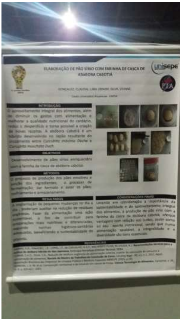
Figura 3. Produção de pão sírio com casca de abóbora cabotiá.