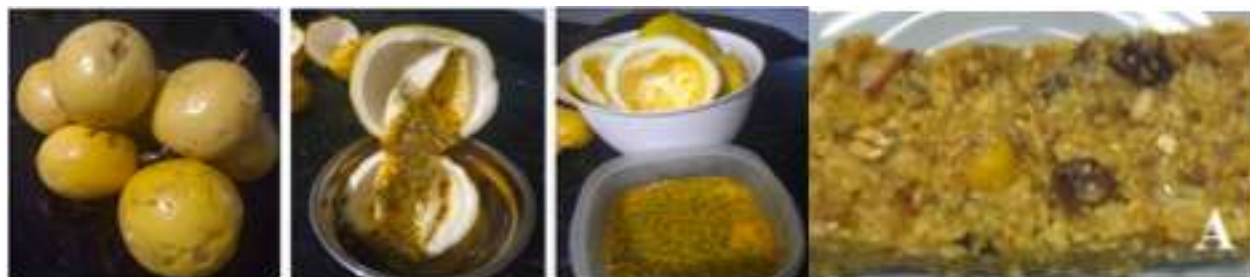
Figura 2. Produção de barra de cereal com a utilização integral do maracujá

Os trabalhos foram apresentados a comunidade acadêmica na Jornada Científica no dia 21 de novembro de 2018.