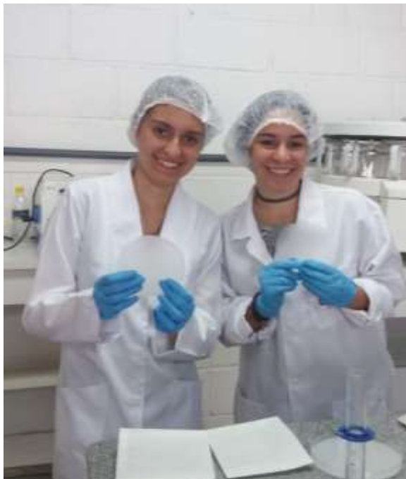
Figura 1. Desenvolvimento de embalagens biodegradáveis

ano do ensino médio da Escola Estadual "Rangel Pestana" de Amparo-SP, apresentado à comunidade na feira.