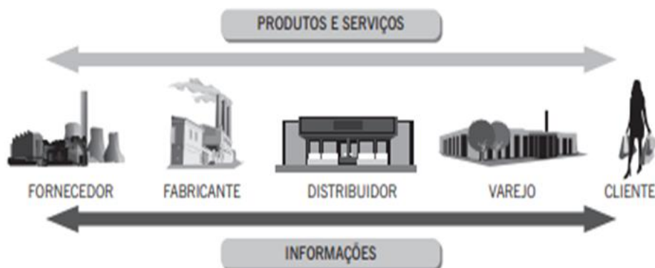
Figura 1: Esquema representando uma Cadeia de Suprimentos

(velocidade, confiabilidade, redução de custos e qualidade) ao longo desse processo (tanto internamente, em cada organização, como entre as organizações), visando à satisfação do consumidor (ao atender e até superar suas expectativas) (PLATT,2015).