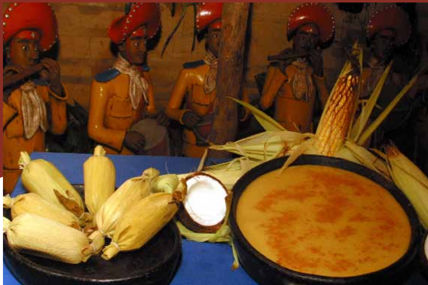
Foto: Prato típico nordestino - Pamonha e Curau / Hans - Ministério do Turismo

From the French lands, came the steps and markings inspired on the European royalty dance. From China, the famous fireworks. The strips dance, pretty common in South of Brazil, is original from Portugal and Spain.